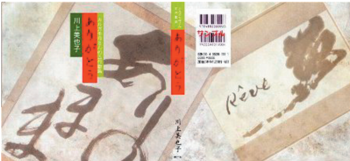
「五行歌集 『ありがとう』」カバー見本